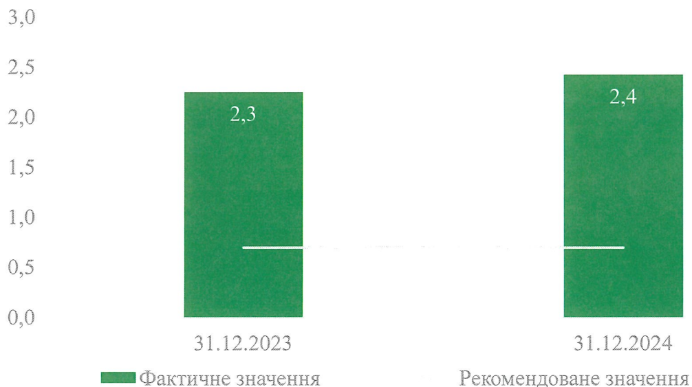
Рисунок 3.1. Коефіцієнт швидкої ліквідності

Коефіцієнт швидкої ліквідності показує наскільки ліквідні кошти підприємства покривають його короткострокову заборгованість. В ліквідні активи підприємства включаються всі оборотні активи підприємства, за винятком товарно-матеріальних запасів. Рекомендоване значення даного показника від 0,7-0,8 до 1,5. Станом на 31.12.24 ліквідні кошти Товариства покривають його короткострокову заборгованість на 100% (на 31.12.23 – 100%).