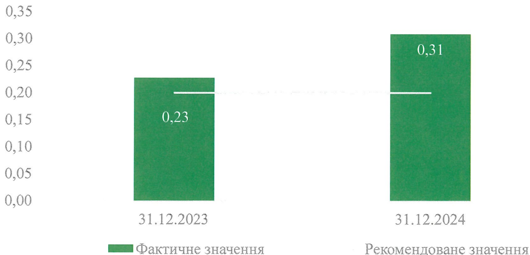
Рисунок 3.4. Коефіцієнт довгострокових зобов'язань